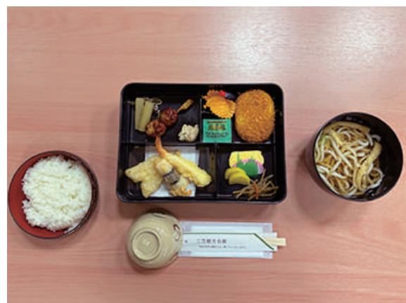
南都定食(A) ¥2,200 (税込)