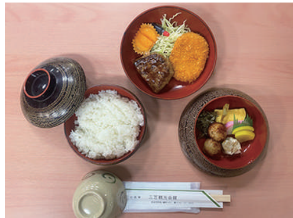
ハンバーグ弁当 ¥1,200 (税込)