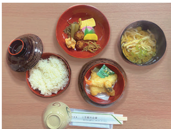
僧兵弁当(中・うどん付) ¥1,870 (税込)