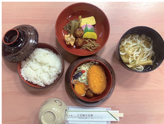
僧兵弁当(うどん付) ¥1,450 (税込)