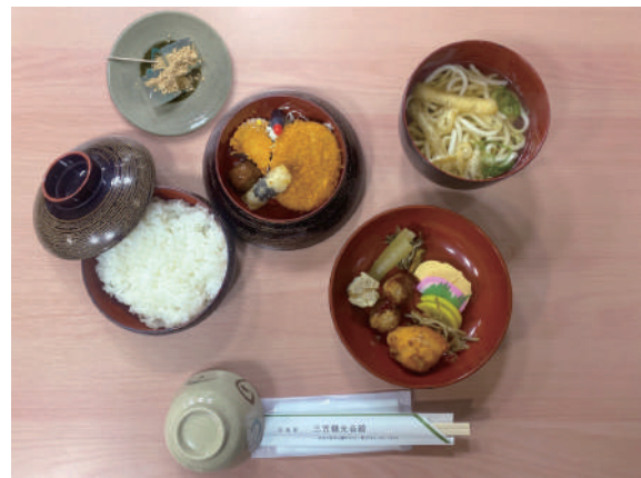
学生まんぷくセット(A上・葛餅付) ¥1,980 (税込)